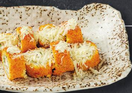
ТЕМПУРА ЦЕЗАРЬ 8 шт. - 240 гр 420 с курицей х/к, соусом и сыром Пармезан