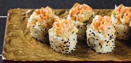
РОПП С ТАРТАРОМ 6 шт. - 240 гр 470 из гребешка