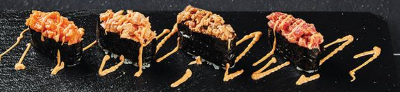
ГУНКАН СПИСУ с лососем - 2 штуки