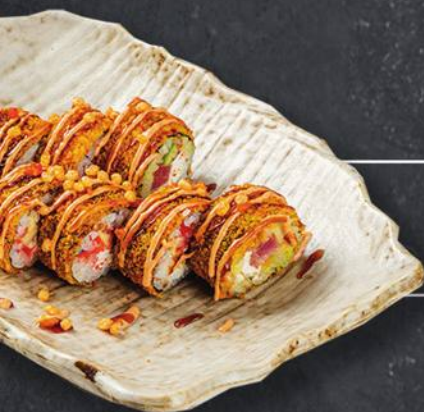
ТЕМПУРА С ТУНЦОМ 8 шт. - 280 гр 460 с соусом Терияке