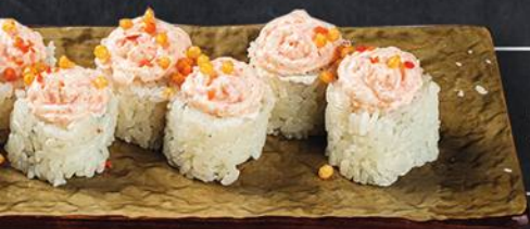
ПАВА МАКИ 8 шт. - 225 гр 420 с лососем и огурцом