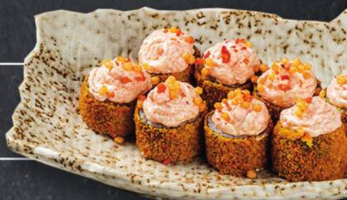
ТЕМПУРА ПАВА 8 шт. - 260 гр 540 с лососем