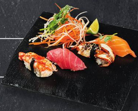
НИГИРИ - 200 гр 475 охлажденный лосось, тунец, креветка, угорь