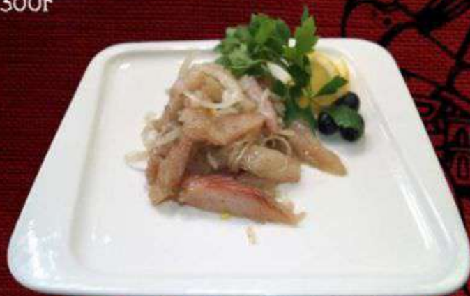
САГУДАЙ ИЗ МУКСУНА 560р

Ассорти из благородных сортов сыра, аппетитно выложенных на тарелке с орехами, сладким виноградом и душистым мёдом. 300г