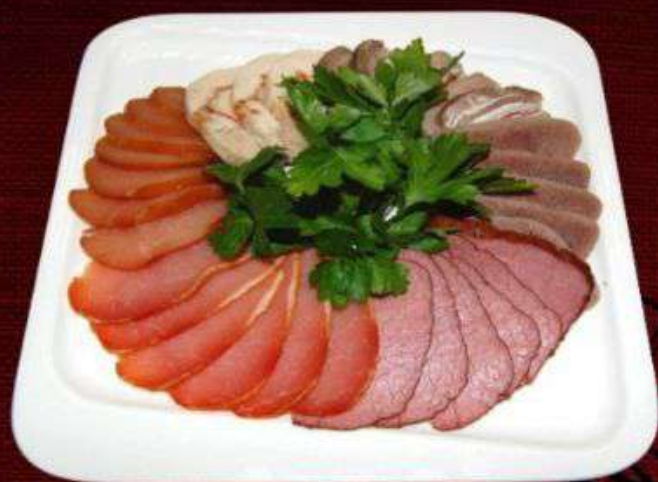
МЯСНАЯ ПАЛИТРА 670р

Говядина в/к, курица, рулет куриный, говядина с/к, язык отварной. 300г