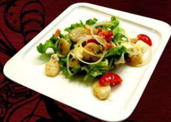
САЛАТ С ГРЕБЕШКОМ 940р

Отварная говядина в сочетании с картофелем пай, маринованной свеклой, морковью и капустой 180г