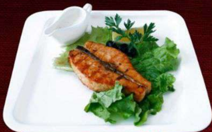
СТЕЙК ИЗ СЁМГИ