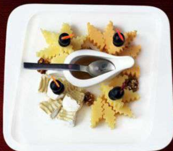
СЫРНАЯ ТАРЕЛКА 910р

Говядина в/к, курица, рулет куриный, говядина с/к, язык отварной. 300г