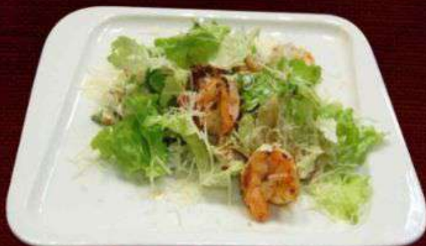
САЛАТ С ТИГРОВЫМИ КРЕВЕТКАМИ И ГРУШЕЙ 970р

Тигровые креветки, груша, помидоры Черри, сыр, лист салата 210г