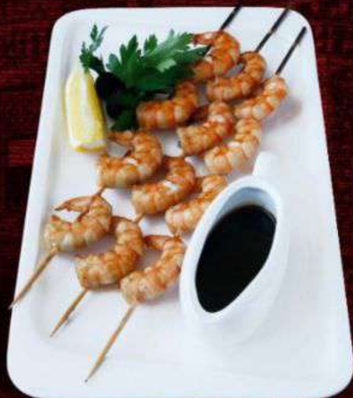
ТИГРОВЫЕ КРЕВЕТКИ НА ГРИЛЕ 980р

Сочная куриная грудка - отличный источник белка. 100/190г