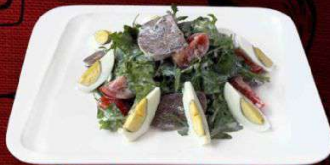
РУККОЛА С ЯЗЫКОМ 590р

Отварной язык, говядина в/к, шампиньоны, свежий огурец. 200г