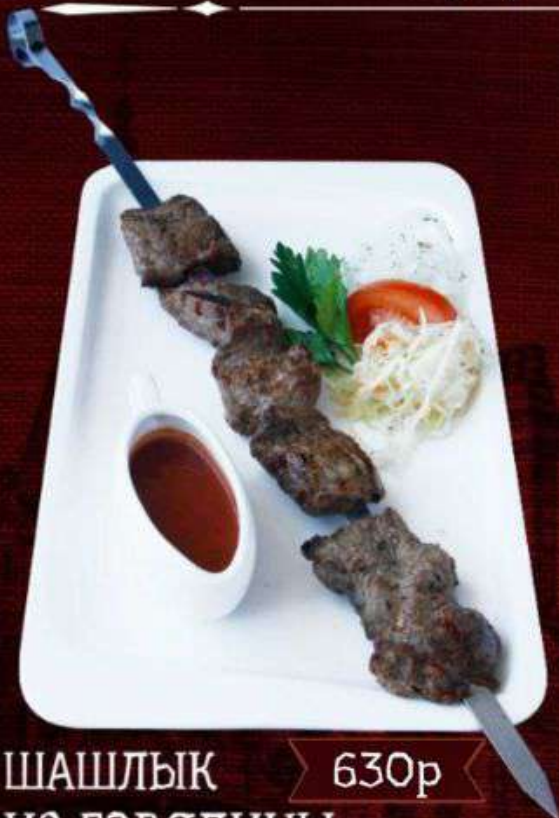
ШАШЛЫК ИЗ ГОВЯДИНЫ 630р

Низкокалорийная говяжья вырезка, приготовленная на берёзовых углях. Подаётся с маринованной капустой, луком и шашлычным соусом. 100/190г