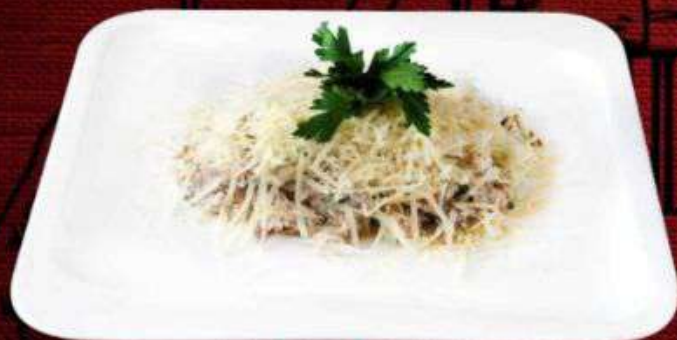
МИР ТЕСЕН 560р

Морской гребешок, помидоры Черри, сыр рассольный, лук репчатый, зелень 190г