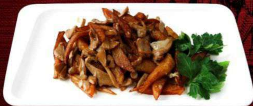
КАРТОФЕЛЬ ЖАРЕНый С ГРИБАМИ