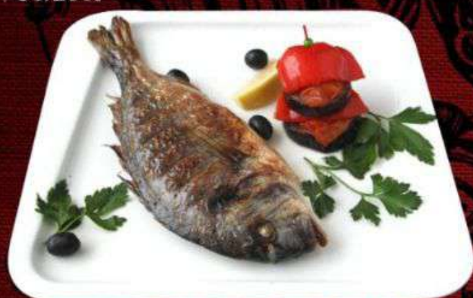
ДОРАДО НА ГРИЛЕ

Блюдо, которое по достоинству оценят настоящие гурманы. Нежное, ароматное и потрясающе вкусное мясо сёмги позволит вам насладиться дарами моря. 90/200г