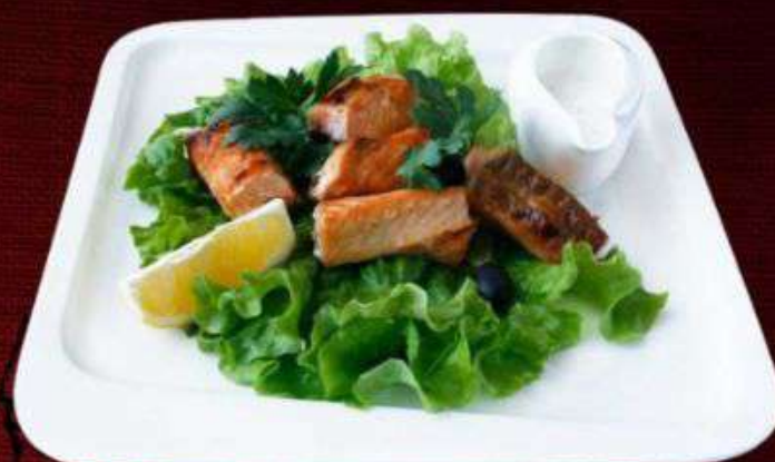
ШАШЛЫК ИЗ СЁМГИ

Вкусное, сытное и вместе с тем эстетическое блюдо станет украшением вашего стола и понравится всем любителям красной рыбы. 90/200г