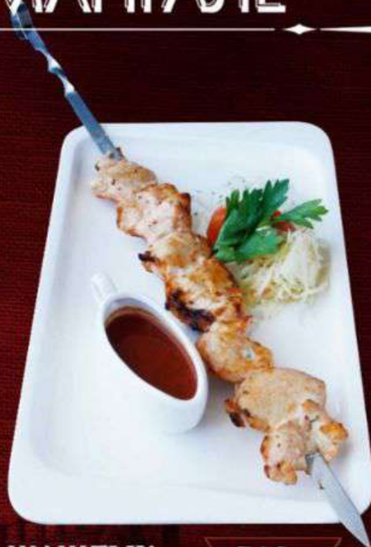
ШАШЛЫК КУРИНЫЙ 560р

Низкокалорийная говяжья вырезка, приготовленная на берёзовых углях. Подаётся с маринованной капустой, луком и шашлычным соусом. 100/190г