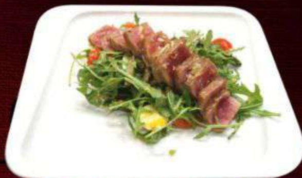
САЛАТ С ТУНЦОМ 870р

Тигровые креветки, груша, помидоры Черри, сыр, лист салата 210г