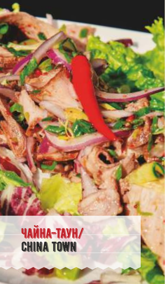
ЧАЙНА-ТАУН/ CHINA TOWN