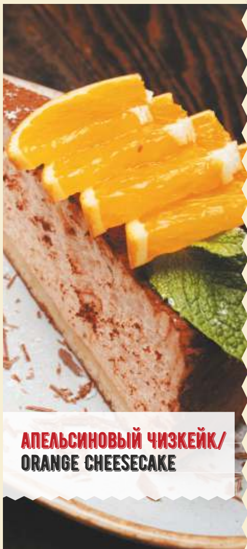
АПЕЛЬСИНОВЫЙ ЧИЗКЕЙК/ ORANGE CHEESECAKE