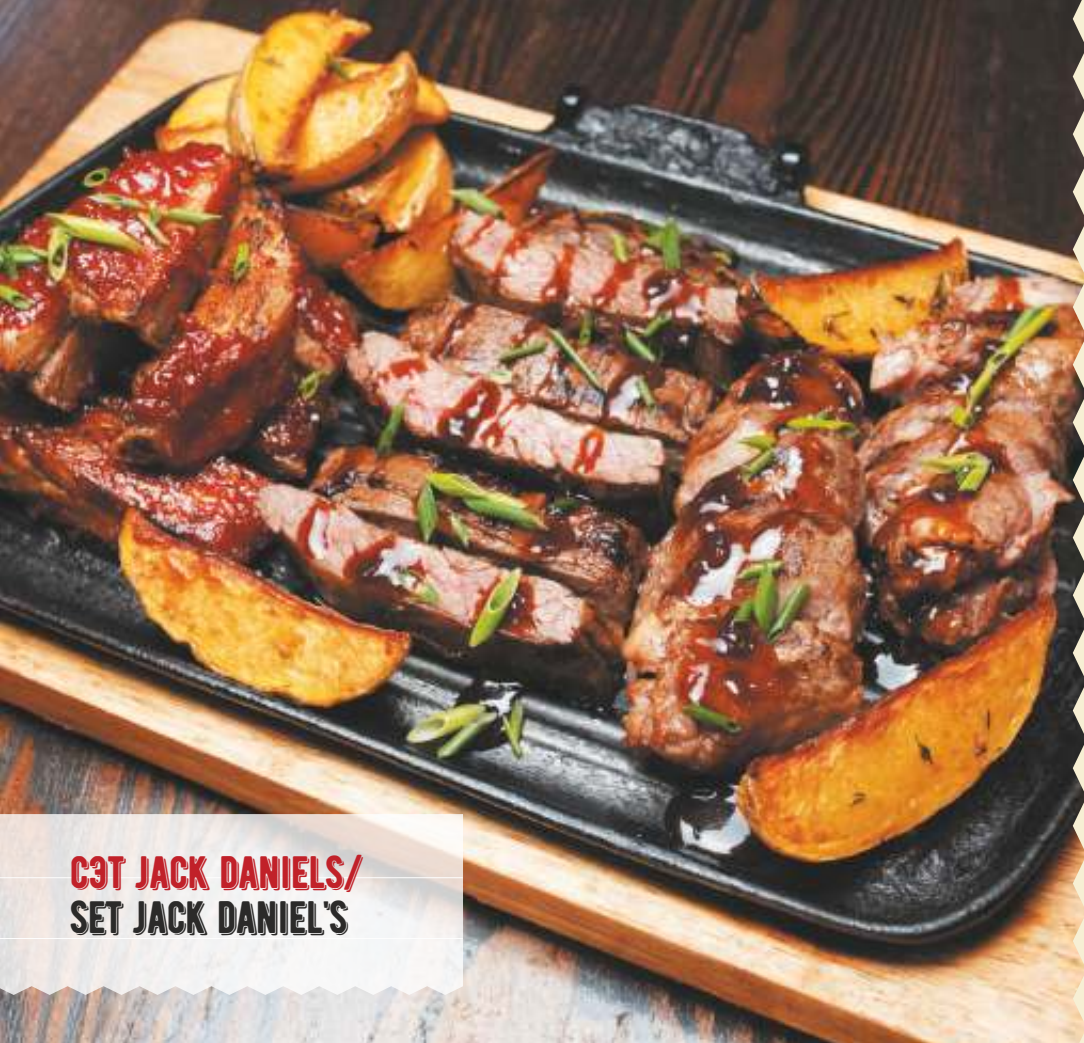
СЭТ JACK DANIELS/ SET JACK DANIEL'S