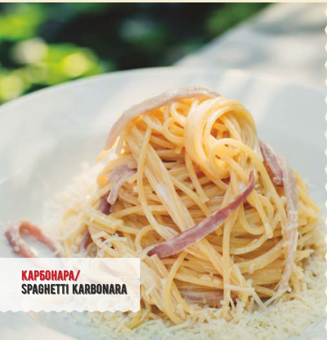
КАРБОНАРА/ SPAGHETTI KARBONARA