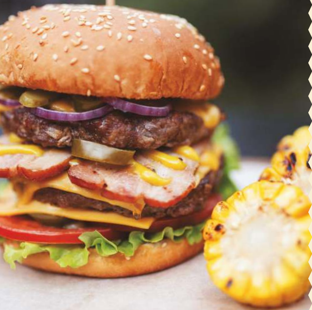
ДАБЛ БИФФ/ DOUBLE BEEF