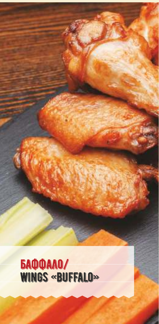
БАФФАЛО/ WINGS «BUFFALO»