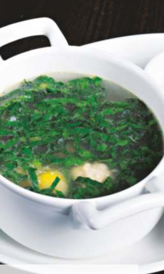
ЩАВЕЛЬНЫЕ ЩИ/ SORREL SOUP