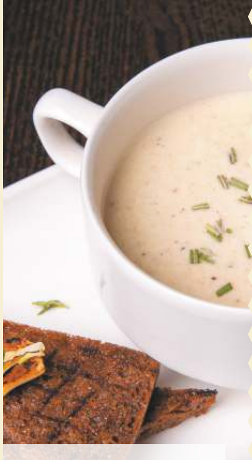
СУП-ПЮРЕ ИЗ БЕЛЫХ ГРИБОВ/MUSHROOM SOUP PUREE