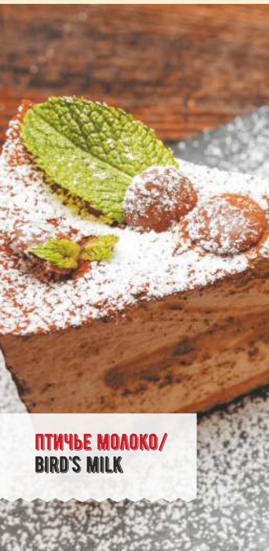
ПТИЧЬЕ МОЛОКО/ BIRD'S MILK