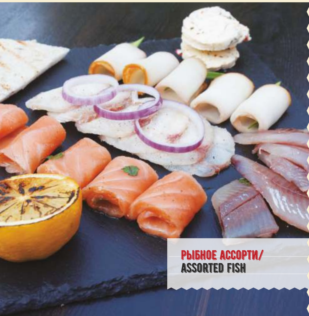
РЫБНОЕ АССОРТИ/ ASSORTED FISH