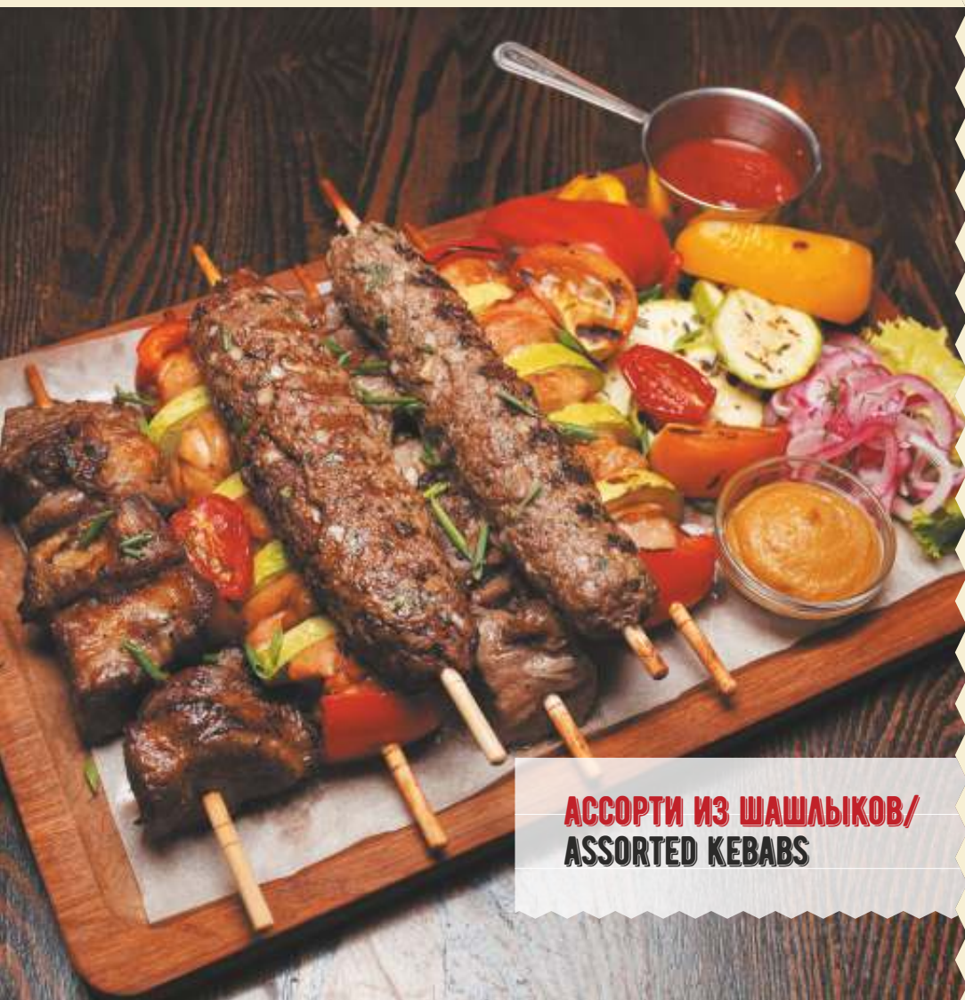
АССОРТИ ИЗ ШАШЛЫКОВ/ ASSORTED KEBABS