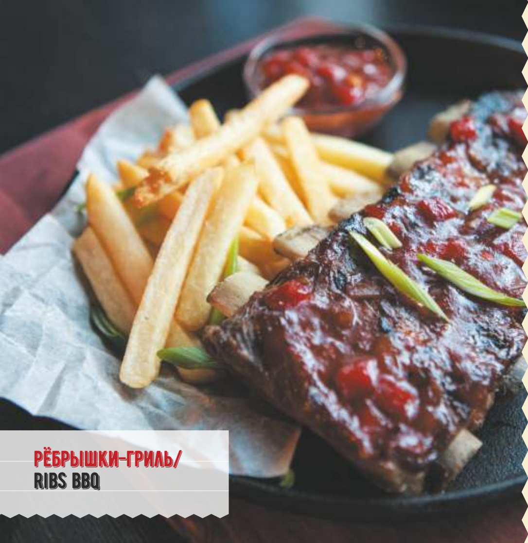
РЁБРЫШКИ-ГРИЛЬ/ RIBS BBQ