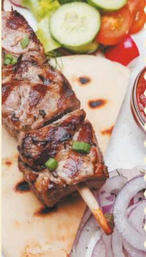
ШАШЛЫК ИЗ СВИНИНЫ/ PORK KEBAB