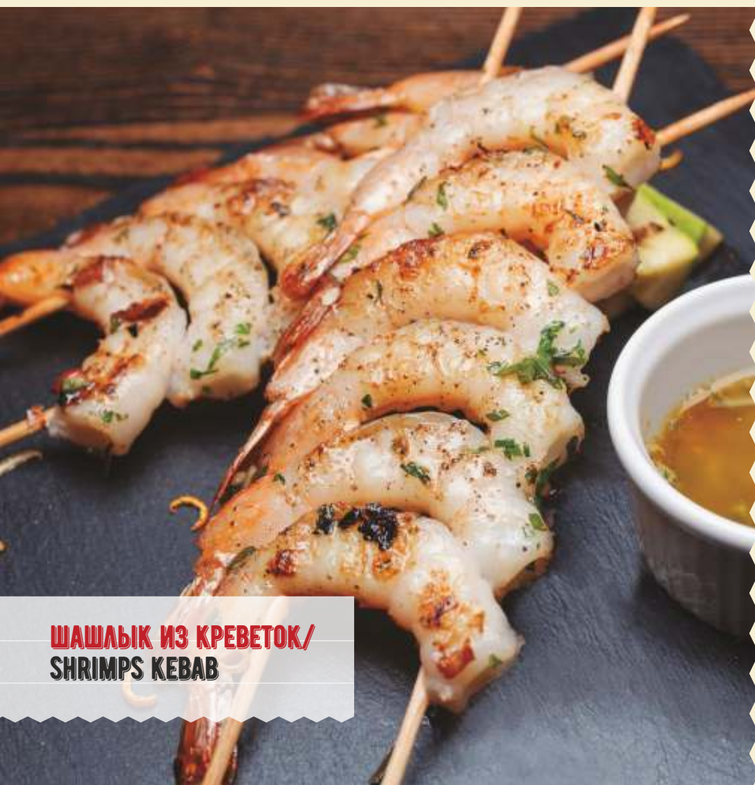
ШАШЛЫК ИЗ КРЕВЕТОК/ SHRIMPS KEBAB