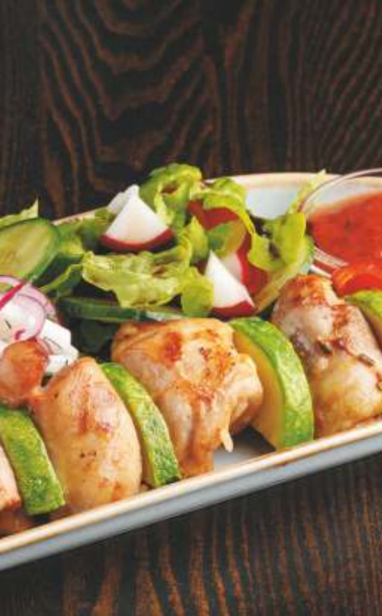
КУРИНЫЙ ШАШЛЫК/ CHICKEN KEBAB