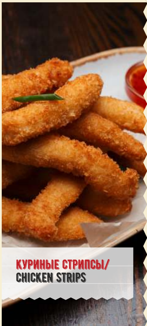
КУРИНЫЕ СТРИПСЫ/ CHICKEN STRIPS