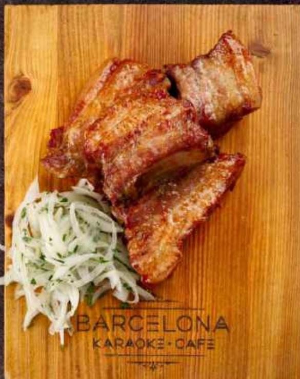
Рёбра свиные 250/20гр. свиные рёбра, лук 208 кКал / 100гр 480 р