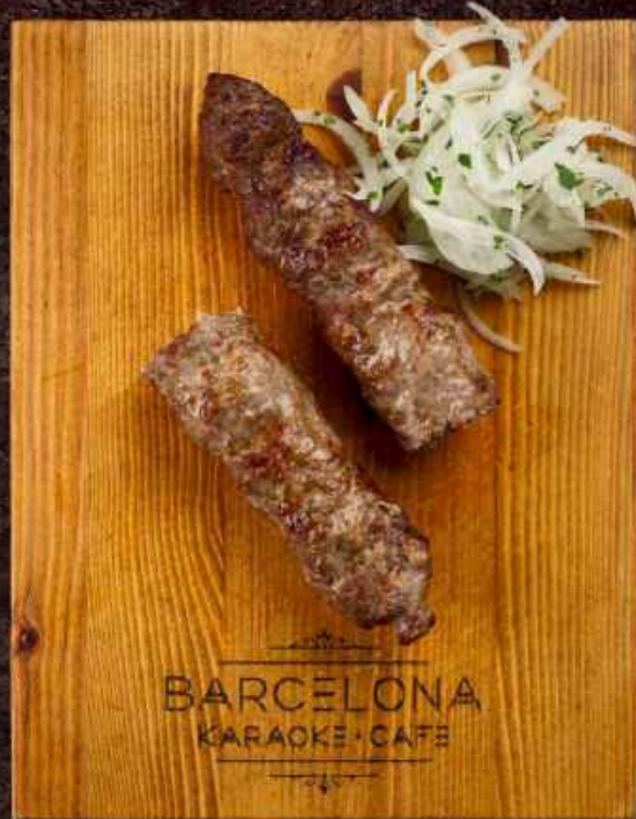
Люля говядина 170/20гр. говядина, лук 208 кКал / 100гр 480 р