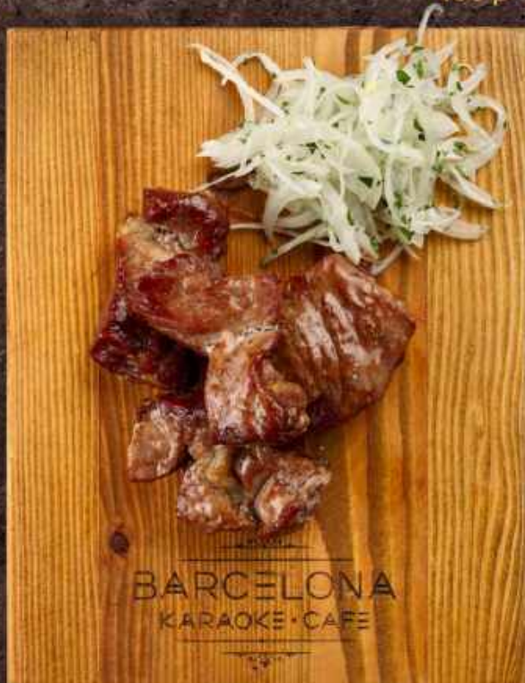
Свинина отборная 200/20гр. шея свиная, лук 324 кКал / 100гр 560 р