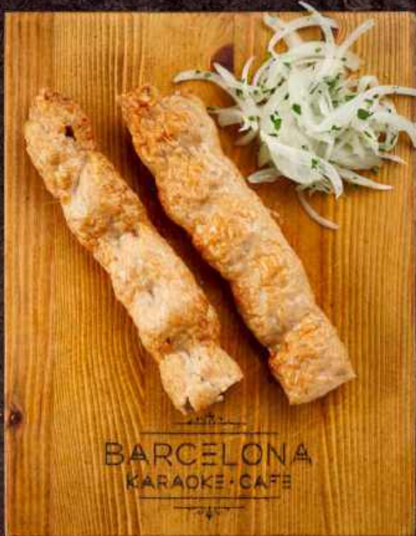
Люля курица 170/20гр. мясо прицы, лук 204 кКал / 100гр 460 р