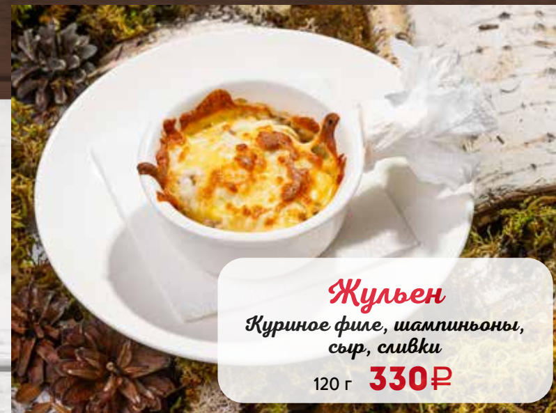
Жульен Куриное филе, шампиньоны, сыр, сливки 120 г 330₽