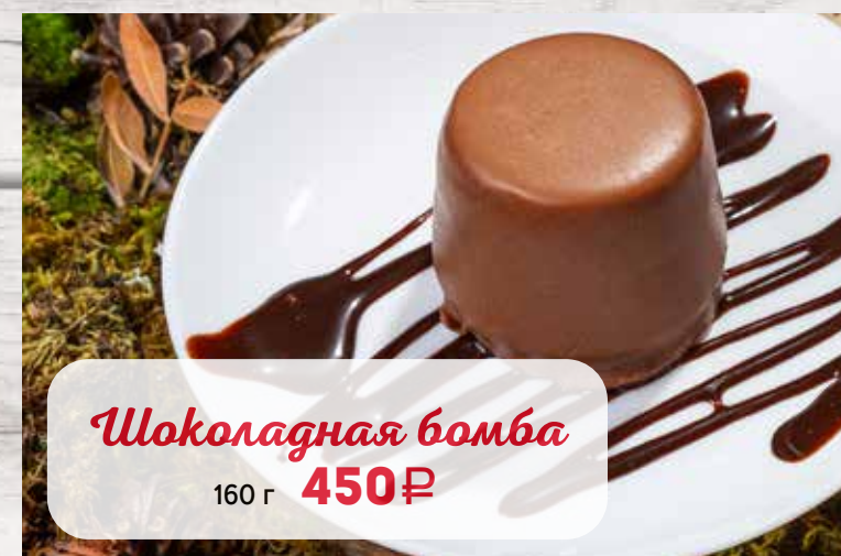
Шоколадная бомба 160 г 450₽