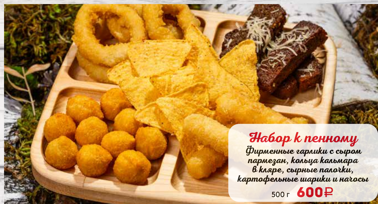
Набор к пенному Фирменные гарники с сыром пармезан, кольца кальмара в кляре, сырные палочки, картофельные шарики и нагосы 500 г 600₽