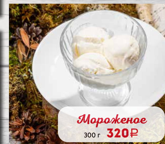
Мороженое 300 г 320₽