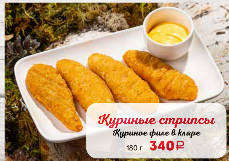
Куриные стрипсы Куриное филе в кляре 180 г 340₽