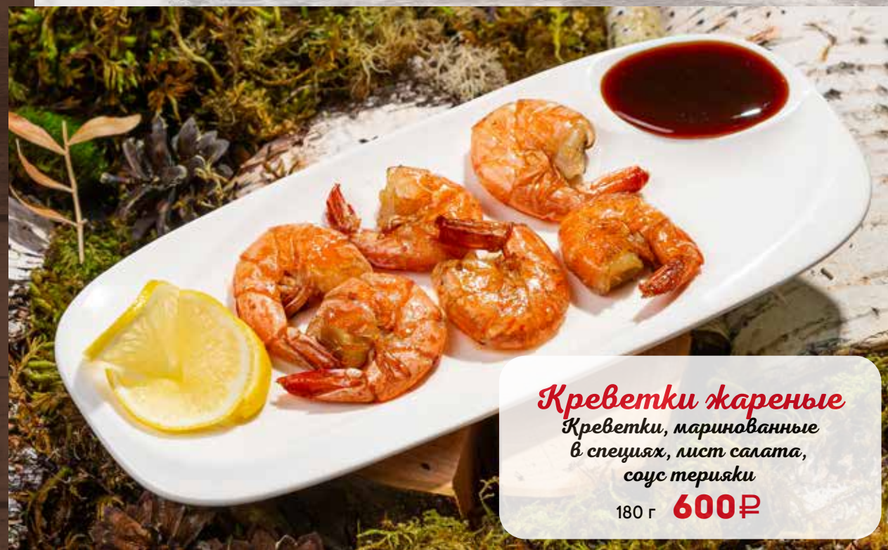
Креветки жареные Креветки, маринованные в специях, лист салата, соус терияки 180 г 600₽