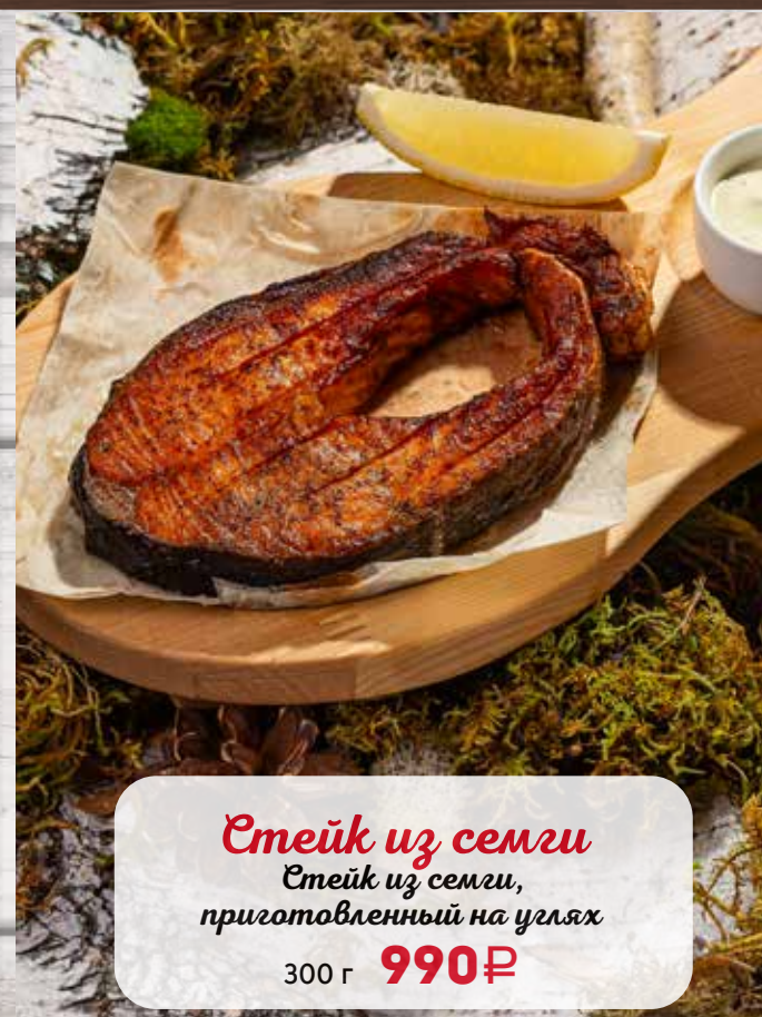
Стейк из семги Стейк из семги, приготовленный на углях 300 г 990₽