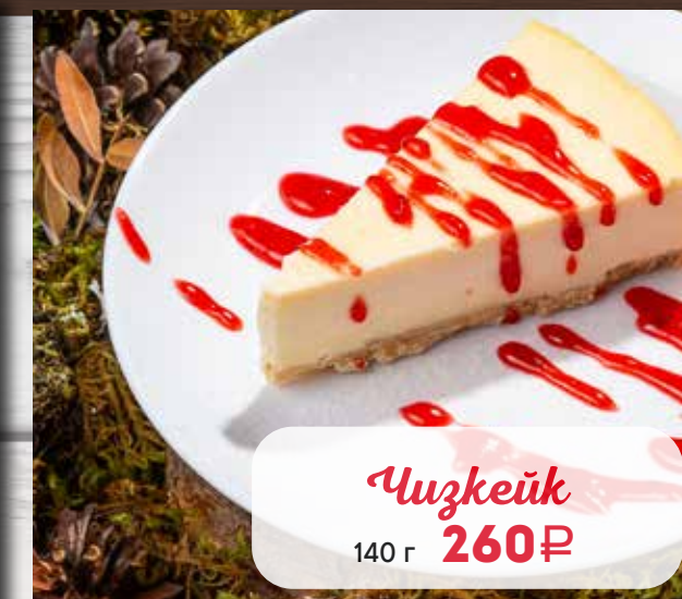
Чизкейк 140 г 260₽