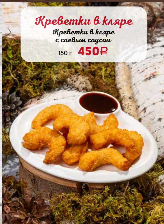
Креветки в кляре Креветки в кляре с соевым соусом 150 г 450₽