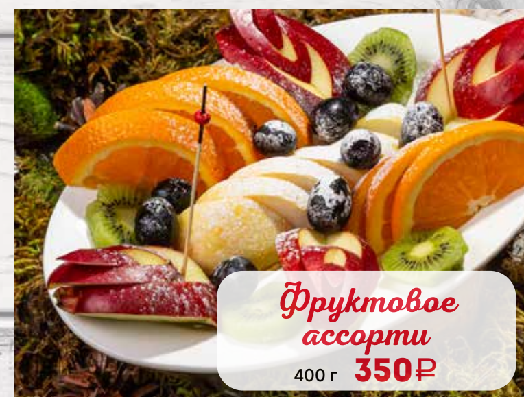
Фруктовое ассорти 400 г 350₽