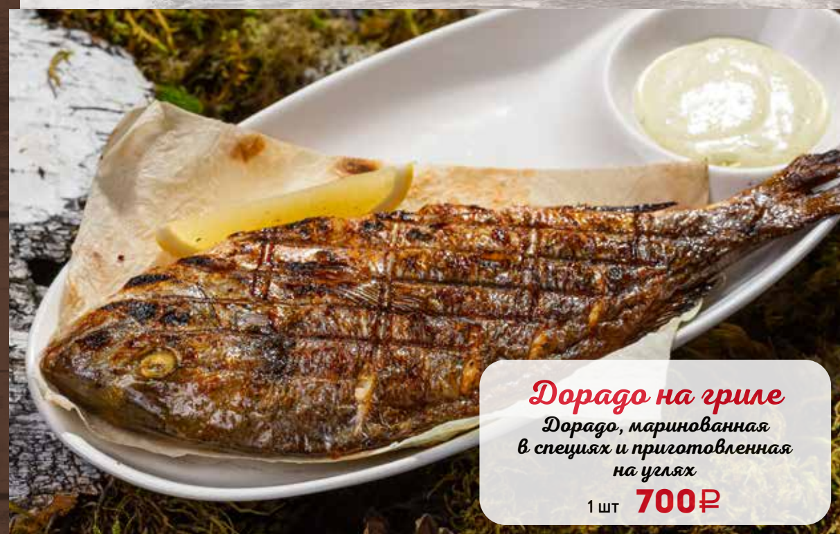
Дорадо на гриле Дорадо, маринованная в специях и приготовленная на углях 1 шт 700₽