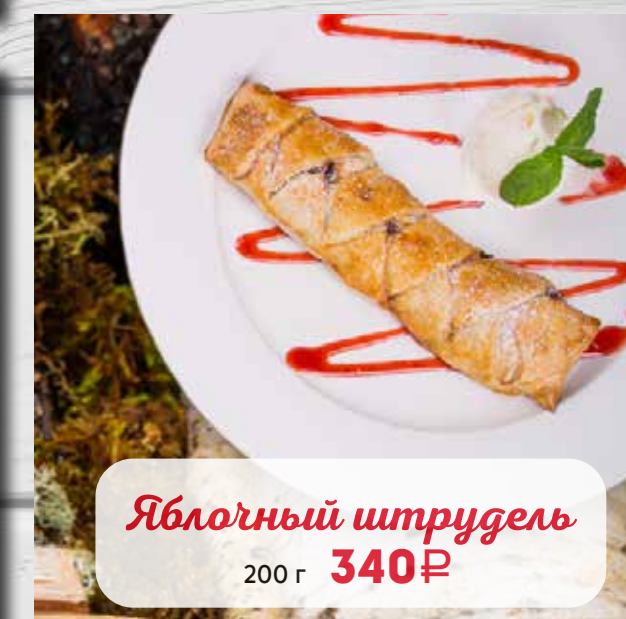
Яблочный штрудель 200 г 340₽