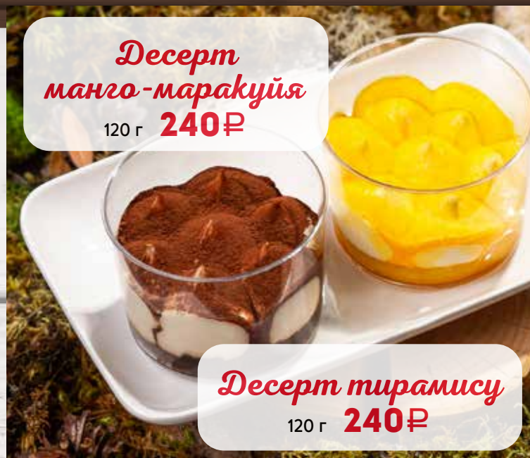
Десерт тирамису 120 г 240₽