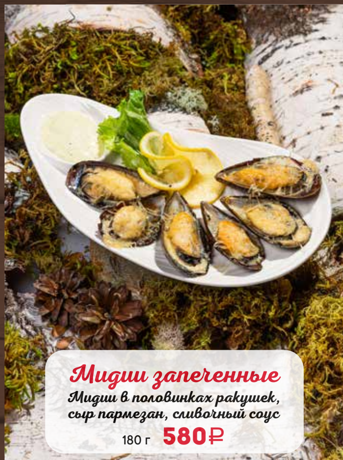
Мидии запеченные Мидии в половинках ракушек, сыр пармезан, сливочный соус 180 г 580₽