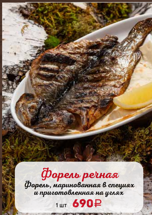
Форель речная Форель, маринованная в специях и приготовленная на углях 1 шт 690₽