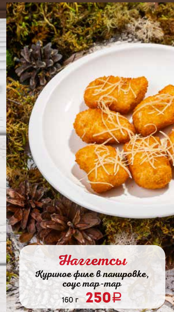
Наггетсы Куриное филе в панировке, соус тар-тар 160 г 250₽