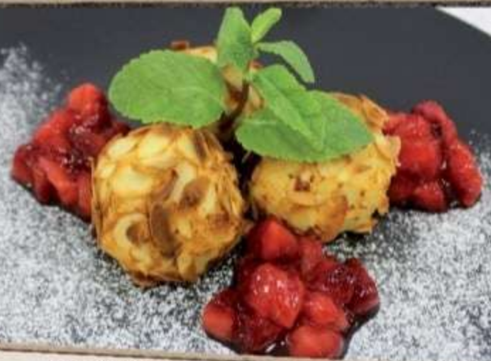
ПОКОРИТЕЛЬ ЗАРИ (творожные крокеты в миндале с тартаром из клубники) 130/100.....270 Р