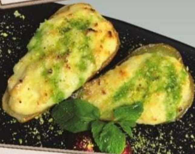
СКАРЛЕТТ (груша, запеченная с рикоттой и фисташками) 200.....250 Р