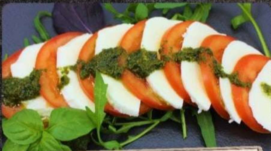
ИТАЛЬЯНСКОЕ ПУТЕШЕСТВИЕ (Томаты с моцареллой, рукколой и соусом Песто)