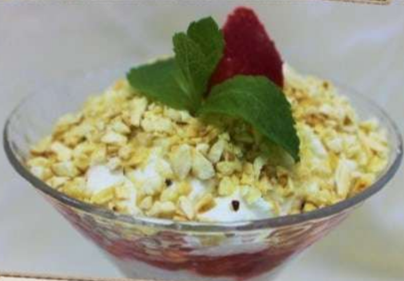
НЕБО МОНТАНЫ (клубника с рикоттой и миндалем) 170 .....250 Р