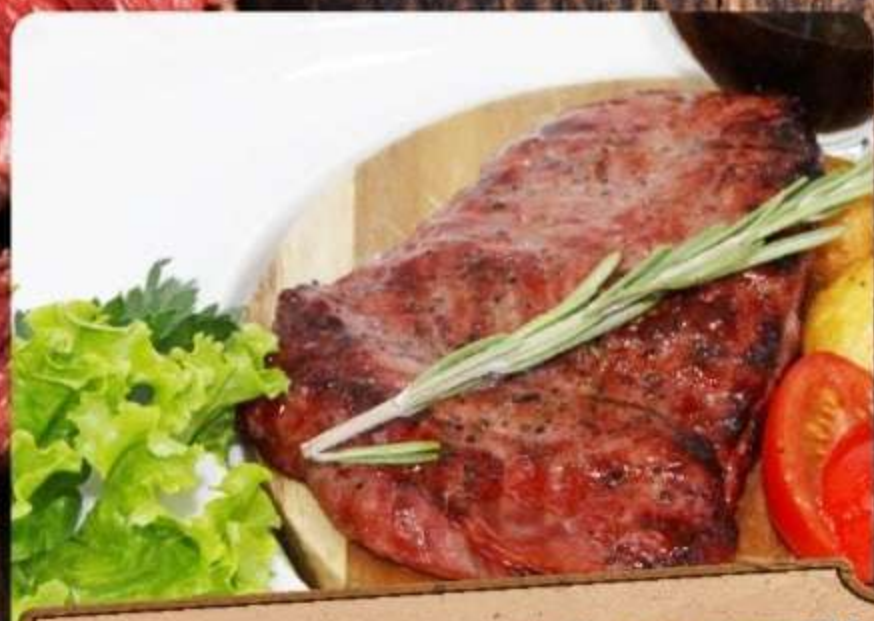
СТЕЙК ИЗ ГОВЯЖЬЕЙ ВЫРЕЗКИ 160.....750 Р