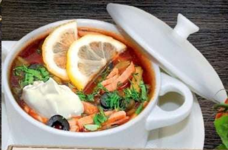
ЧАРЛЬЗ БУКОВСКИ (солянка мясная)