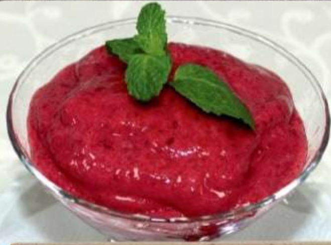
АЛЫЕ ПАРУСА (мусс из малины и банана или смородины и банана) 200.....230 Р