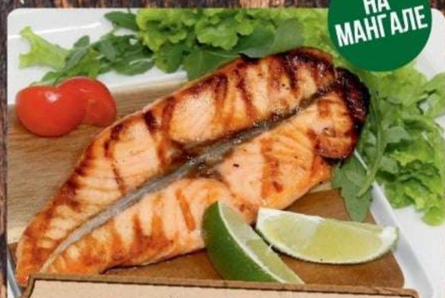
СТЕЙК ИЗ СЕМГИ 160.....850 Р икорный соус.....150 Р шпинатный соус.....70 Р