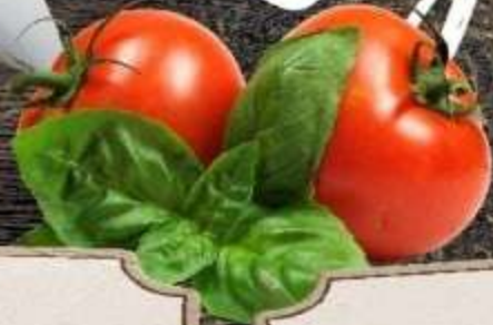
ГИ ДЕ МОПАССАН