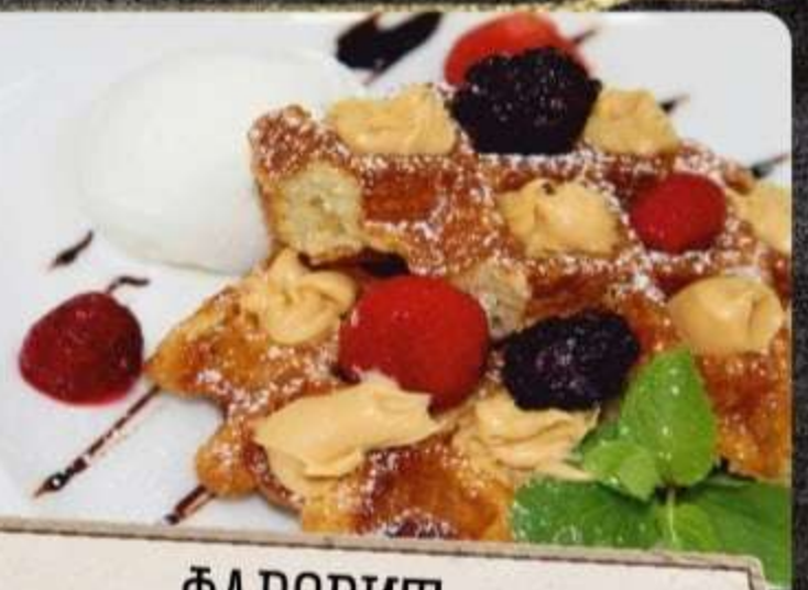
ФАВОРИТ (бельгийская вафля со сливочно- карамельным соусом, фруктами и шариком мороженого) 130/50.....250 Р