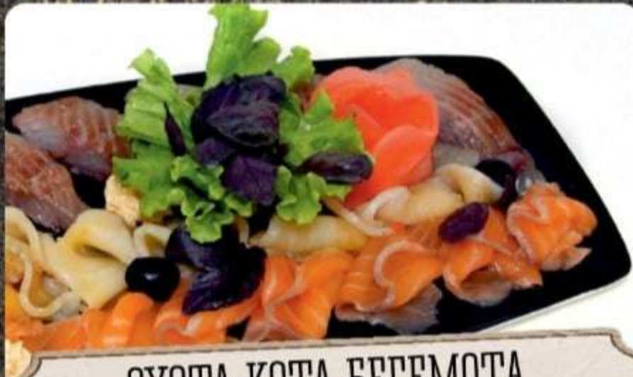
ОХОТА КОТА БЕГЕМОТА (рыбное ассорти)