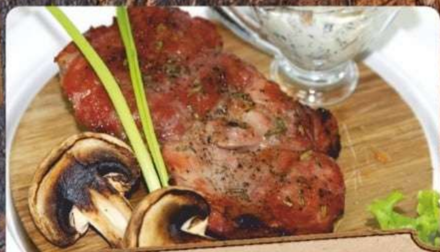
СТЕЙК ИЗ СВИНОЙ ШЕИ с грибным соусом 180.....390 Р