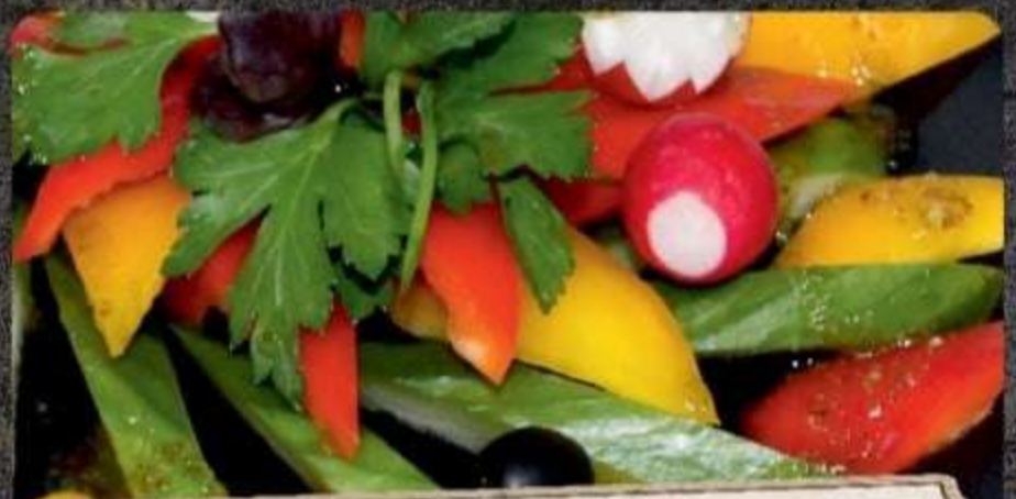
КРАСНОЕ И ЗЕЛЕНОЕ (нарезка из свежих овощей с оливковой заправкой)