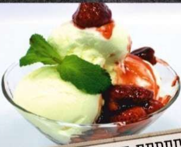
МОРОЖЕННЫЕ БЕРЕГА, КЛУБНИЧНЫЕ РЕКИ (мороженое с клубникой фламбе или мороженое под горячим шоколадом) 150/100.....230 Р