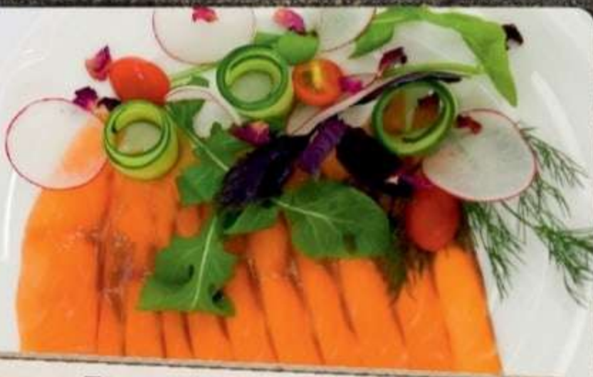
БЕГУЩАЯ ПО ВОЛНАМ (нежное филе малосольной семги)