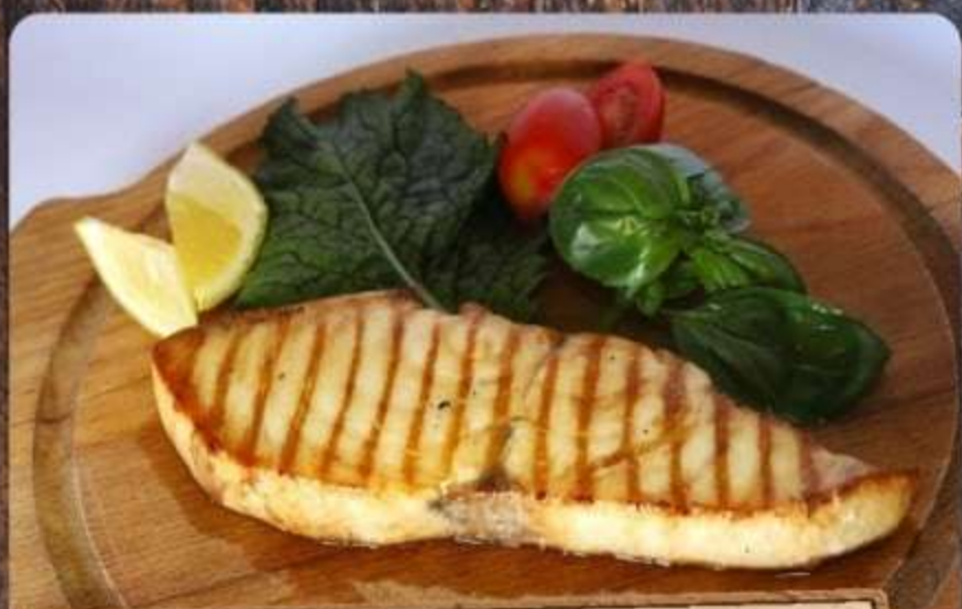
СТЕЙК ИЗ МАСЛЯНОЙ РЫБЫ 150.....510 Р